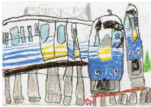
文部科学大臣賞 小学1年