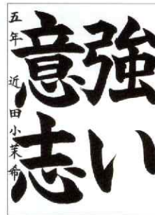
文部科学大臣賞 小学5年