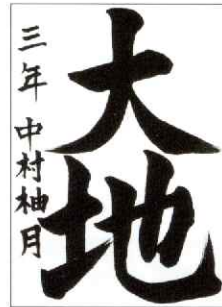
文部科学大臣賞 小学3年