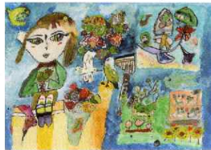
文部科学大臣賞 小学3年