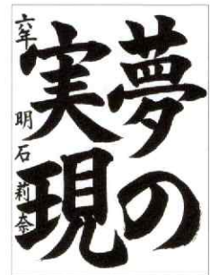
厚生労働大臣賞 小学6年