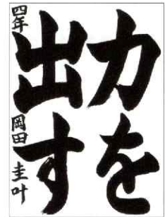
文部科学大臣賞 小学4年