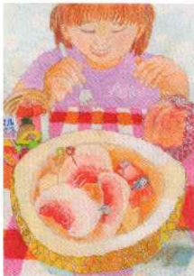
農林水産大臣賞 小学3年