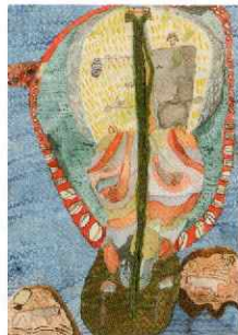
外務大臣賞 小学4年