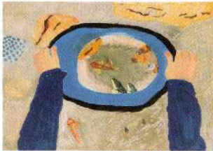
文部科学大臣賞 小学5年