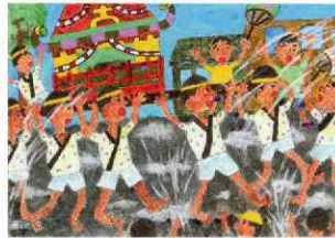
厚生労働大臣賞 小学4年